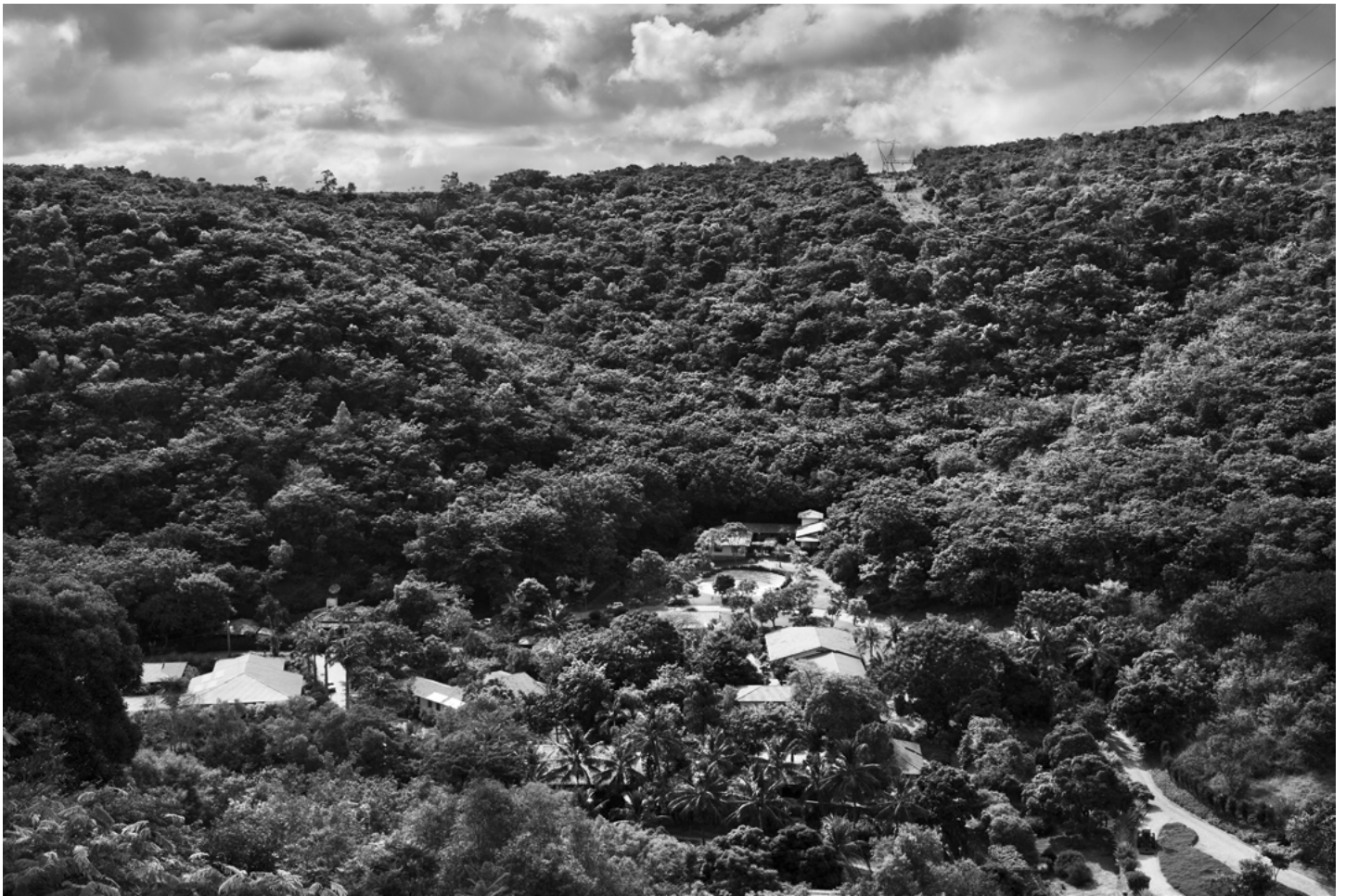
Heute: Das Areal des Instituto Terra, nun beinahe wieder im ursprünglichen Zustand, mit Pflanzen und Tieren im Überfluss.

im Rahmen eines Hilfsprogramms die Farmer und Arbeiter in der Region.