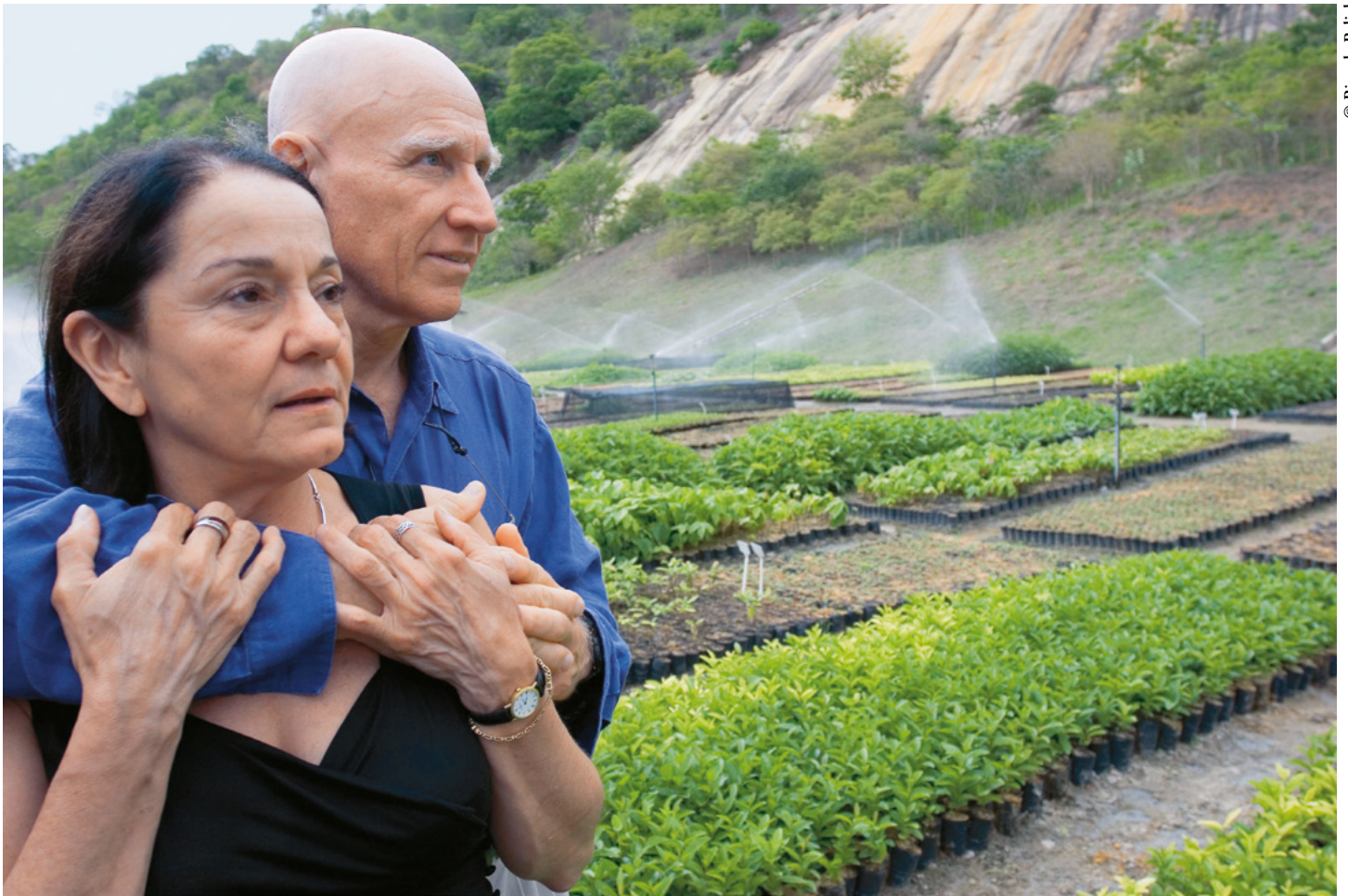
Lélia Wanick Salgado und Sebastião Salgado vor einer Baumschule im Instituto Terra in Aimorés, Minas Gerais, Brasilien, 2013.