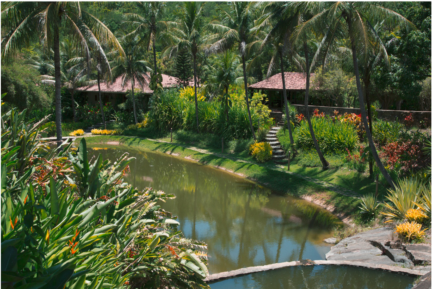
Das wiedererstandene tropische Paradies am Hauptsitz des Instituto Terra, 2013.

hingegen ist es gelungen, dank des Wiederaufforstungsprogramms rund 108 000 Tonnen CO 2 aus der Atmosphäre zu binden.