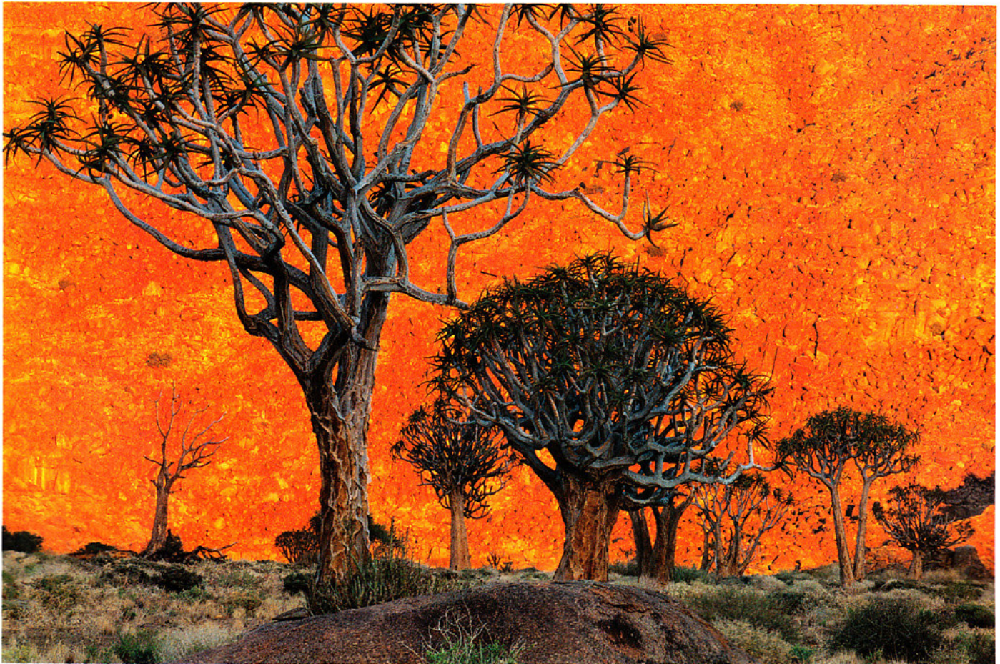
Quiver trees, Aloe dichotoma, Richtersveld National Park, South Africa