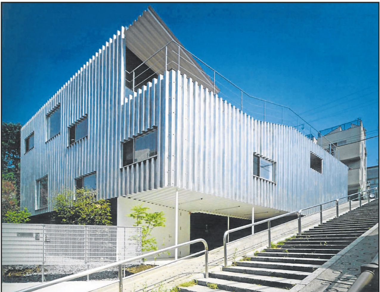
KENGO UMA. En esta página, la Steel House, en Bunkyo-Ku, Tokio. Utiliza el acero corrugado. Es un proyecto de 2006/2007, sobre 285 m 2 .

Texto: Pablo Helman.