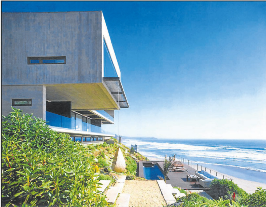
MATHIAS KLOTZ Y NADER KHALILI. Arriba, la 11 Mujeres House, en Calchagua, Chile, sobre 700 m 2 , con su diseño ortogonal, abierta hacia el Pacífico. Abajo, el Sandbag Shelter Prototypes, una base de vivienda social, asentada en sacos de arena, muy simple de construir y que puede adoptar distintas configuraciones.