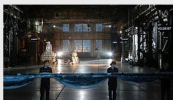
Bühne auf der Ruhrtriennale