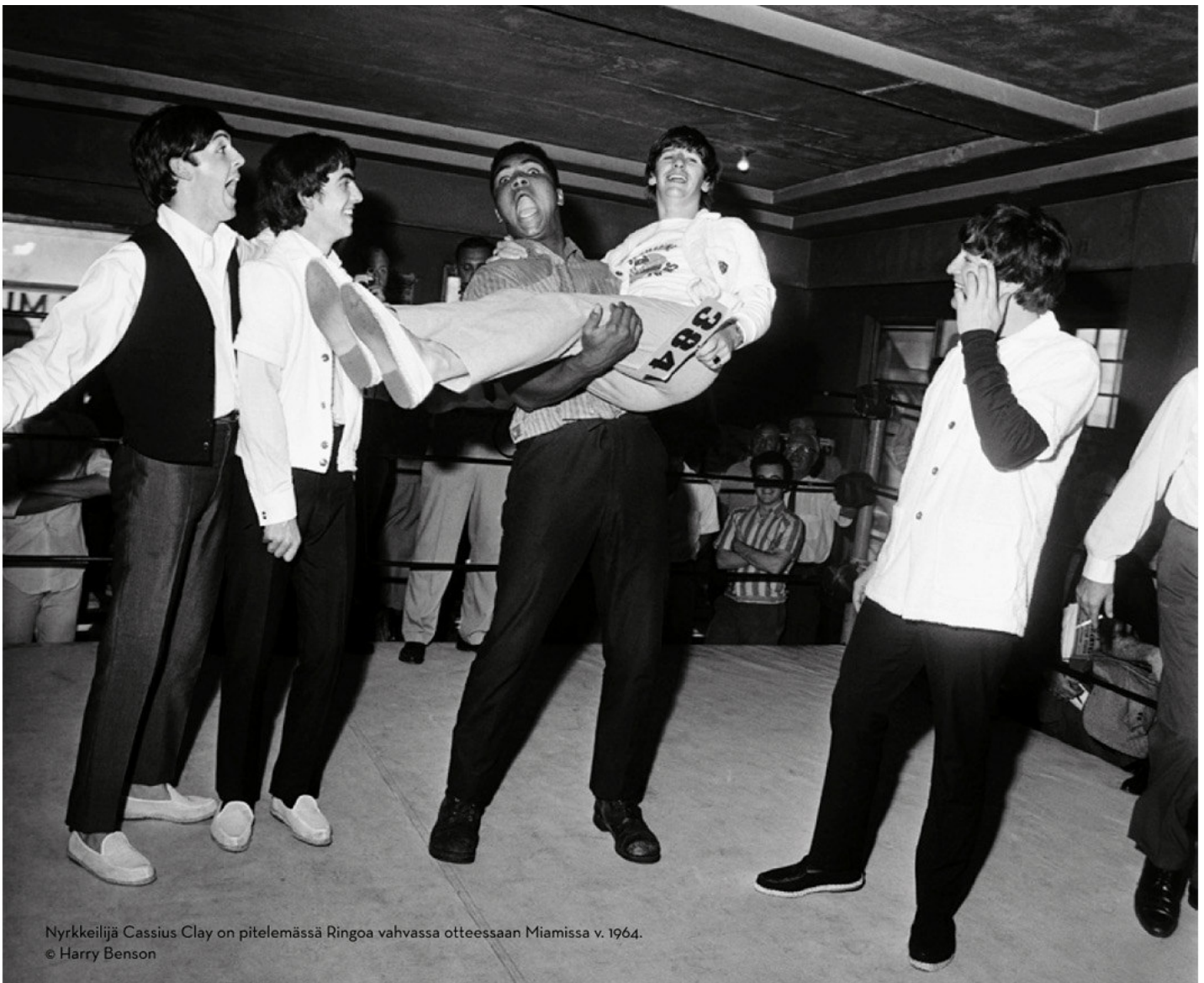
Nyrkkeilijä Cassius Clay on pitelemässä Ringoa vahvassa otteessaan Miamissa v. 1964.