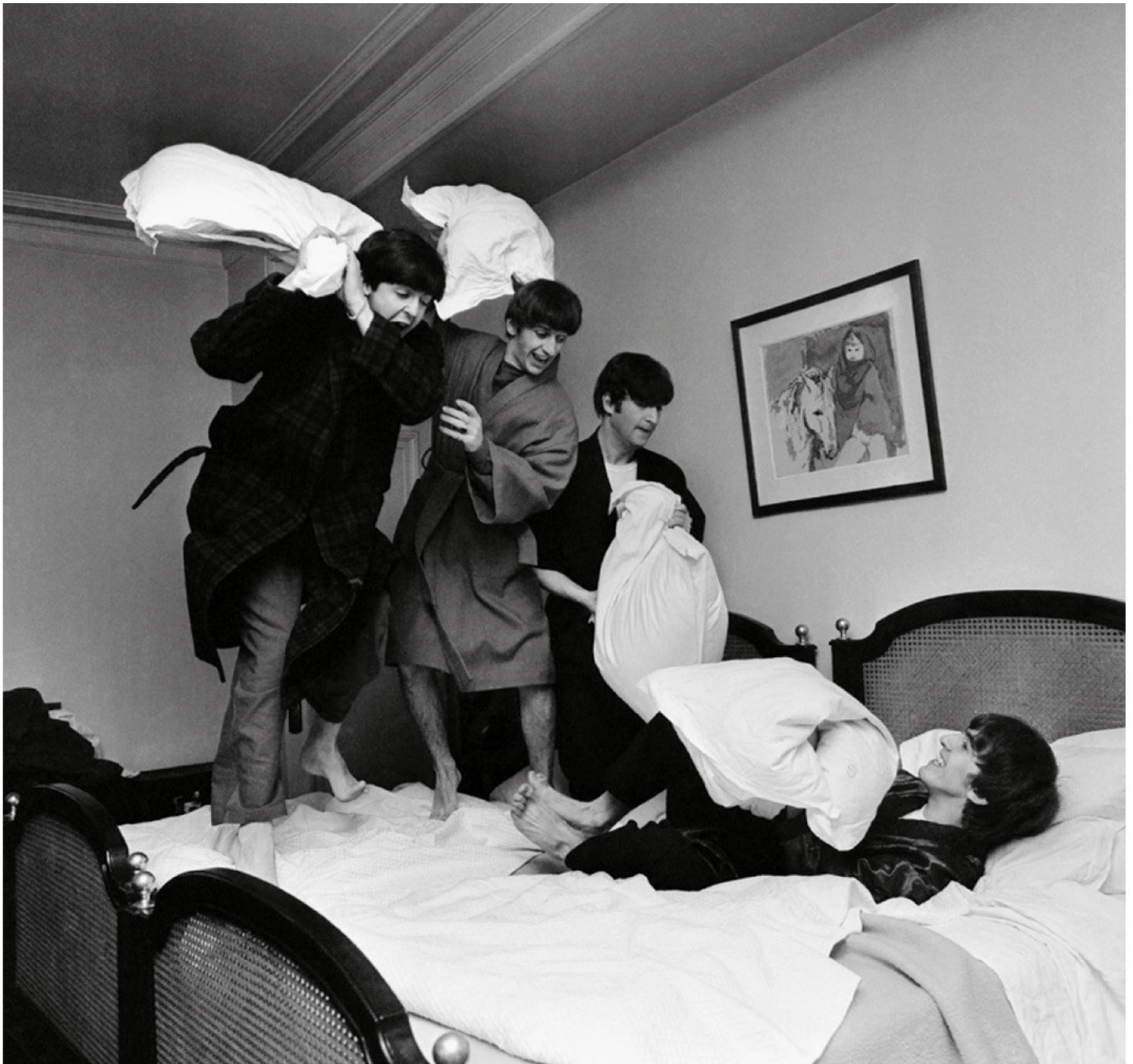
▲ Kuuluisa "tyynysota" -kuva aamukolmelta George V -hotellissa Parii- sissa v. 1964.