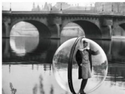
In den 1960er-Jahren führte Melvin Sokolsky seinen surrealistischen Stil in die Modefotografie ein: Seine legendäre Serie zeigt Mannequins, die in Plexiglaskugeln zu schweben scheinen, sei es über Paris oder wie hier auf der Seine.