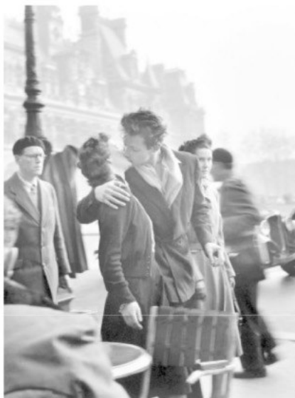
Robert Doisneaus berühmter Kuss vor dem Pariser Rathaus

Die „Camera Obscura“ war als Zeichenhilfe schon seit dem 17. Jahrhundert bekannt. Der „dunkle Kasten“ mit einfachem Objektiv projizierte ein zweidimensionales Abbild der Realität auf eine Glasscheibe, das man nachzeichnen – und nun sogar dauerhaft festhalten konnte. Damit begann, was der Photohistoriker Jean Claude Gautrand eine „Liebesgeschichte zwischen Paris und der Photographie“ genannt hat. Die Schöne an der Seine war die Kinderstube der Lichtbildkunst und ihr erstes Motiv. Und umgekehrt haben später auch die typischen Schwarzweißphotos der Stadt mit ihren Kais, Bouquinisten und Anglern, den Liebenden, Parks und Karussells das romantische Bild dieser Metropole geprägt.