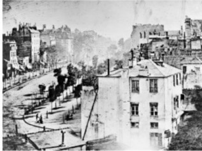
Louis Daguerre „Boulevard du Temple“ von 1838. Weil der Kunde des Schuhputzers während der minutenlangen Belichtungszeit stillstand, ist er als einziger Mensch auf dem Photo zu sehen.

beiden nur durch eine Indiskretion des Optikers Charles Chevalier, der Daguerre die Adresse des erfolgreicherer Niepce gegeben hatte. Der war irgendwann dazu übergegangen, asphaltbeschichtete Zinnplatten zu belichten und machte so die ersten Photographien. Auf Daguerres Angebot, diese „Heliographie“ (Sonnenzeichnung) gemeinsam weiterzuentwickeln und zu vermarkten, war er erst nach langem Zögern eingegangen. Der auf gut Glück herumprobierende Daguerre entdeckte schließlich 1837, dass man die mehrstündige Belichtungszeit mit Quecksilberdampf auf wenige Minuten verkürzen und das Bild mit Kochsalz dauerhaft fixieren konnte. Dazu hatten weder Niepce, der schon 1833 starb, noch sein Sohn und Erbe Isidore etwas beitragen können, so dass Daguerre glaubte, ein ganz neues Verfahren erfunden zu haben.