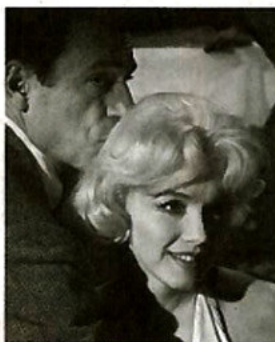
Yves Montand et Marilyn Monroe lors du tournage de Faisons l'amour, en 1960.

Demain, Arte diffuse à 16 h 55 Bert Stern : objectif Marilyn , un portrait de l'homme qui a immortalisé la star six semaines avant sa disparition, notamment dans sa série Last Sitting (la dernière séance). Sur Direct 8, on retrouvera à 22h 45 la comédie culte de Billy Wilder, Certains l'aiment chaud , avec Tony Curtis et Jack Lemmon entourant Marilyn.