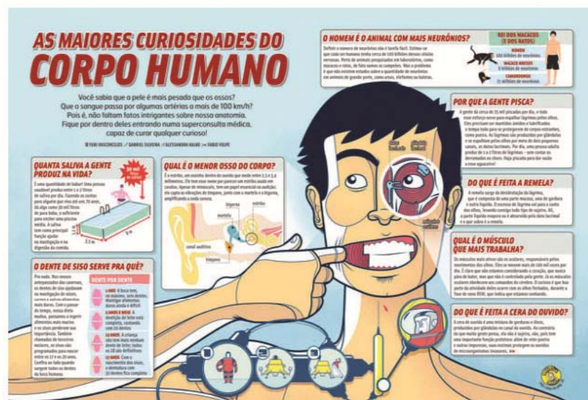
Arriba: The Greatest Curiosities of the Human Body . Mundo Estranho magazine, 2008. Alessandra Kalko & Gabriel Silveira

Sin duda Information Graphics es una referencia obligada e inspiradora para cualquier aficionado que disfrute con la sugerencia de este tipo de trabajos, y también para cualquier profesional que tenga que enfrentarse en su día a día, con el desafío de ordenar grandes cantidades de información.