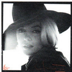
So wollte Marilyn gesehen werden: Als ernstzunehmendes Model, das in der Welt der Haute Couture angekommen war. Auch dieses Bild ist aus dem letzten Shooting

Körper durch Jogging und Gewichtheben in Form, besprach mit jedem ihrer Fotografen, was sie noch verbessern konnte, und probierte vor dem Spiegel aus, in welchen Posen sie am vorteilhaftesten aussah. Marilyn erlernte den Umgang mit Make-up und wurde Expertin auf dem Gebiet. Beim Posieren war sie fröhlich und entgegenkommend. Die Pin-up-Fotografen liebten sie.