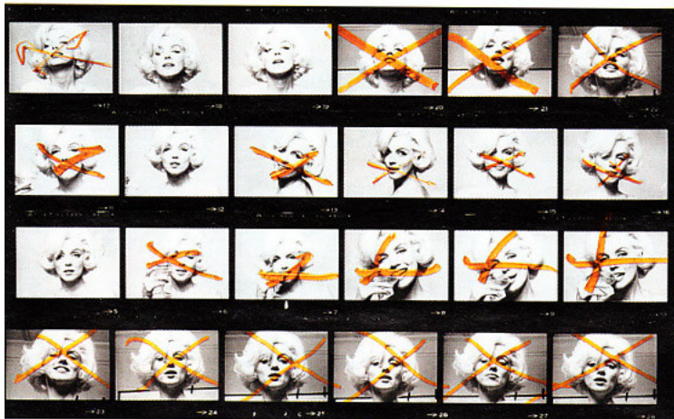
Mit viel Champagner und Wein: Marilyn und Bert Stern beim letzten Shooting