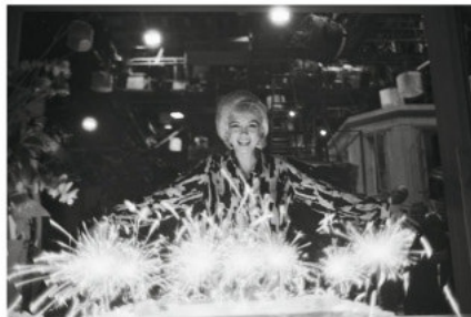
"A huge birthday cake was brought in with sparklers for candles, and Marilyn posed behind it looking joyful and appreciative..." — Lawrence Schiller Monroe celebrates her 36th birthday on set, June 1, 1962.