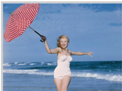
La metamorfosis de Norma Jeane a Marilyn Monroe es retratada por el fotógrafo que la descubrió, Andre de Dienes y editada por Taschen en el 50 aniversario de su muerte.

Marilyn Monroe, la actriz más fotografiada, la estrella que sigue haciendo correr ríos de tinta, todavía hoy es un gran enigma.