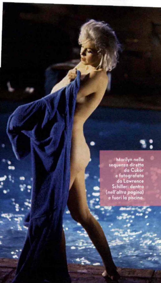
Marilyn nella sequenza diretta da Cukor e fotografata da Lawrence Schiller: dentro (nell'altra pagina) e fuori la piscina.

Quando Marilyn finalmente spuntò dal camerino, indossava un accappatoio di spugna blu sopra a un bikini vivace. Praticamente era in slip e reggiseno. Il cuore cominciò ad accelerare. Saltò nella piscina e iniziò a nuotare. L'acqua era riscaldata a 33 gradi, come un bagno caldo. Galleggiò con la schiena per un po', in silenzio, si sentivano solo le sue risatine. Poi si attaccò al bordo della piscina ed emerse fino alle spalle, con il resto del corpo sotto, dopo qualche altra risata sonora, sollevò la gamba destra sul bordo, tenendo sempre il resto del corpo nascosto. Scattai a raffica, giusto prima che tornasse al centro della piscina. Allora, senza preavviso, tornò nuotando verso il bordo. Non aveva più il reggiseno, solo lo slip, che ave-