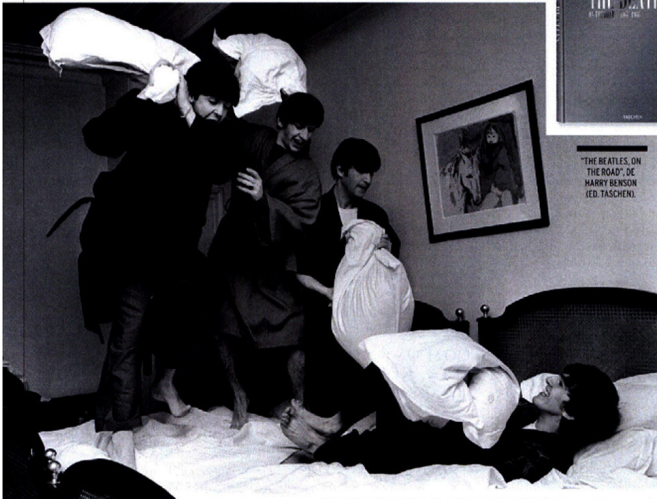
"THE BEATLES, ON THE ROAD", DE HARRY BENSON (ED. TASCHEN).

Em plena Beatlemania, a famosa batalha de travesseiros na suíte do hotel George V, em Paris (1964).