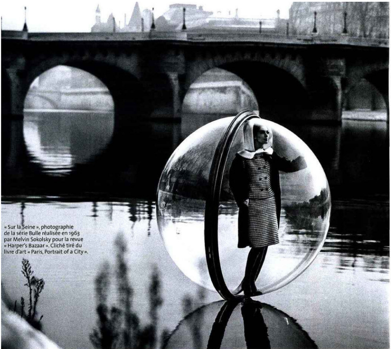
« Sur la Seine », photographie de la série Bulle réalisée en 1963 par Melvin Sokolsky pour la revue « Harper's Bazaar ». Cliché tiré du livre d'art « Paris, Portrait of a City ».