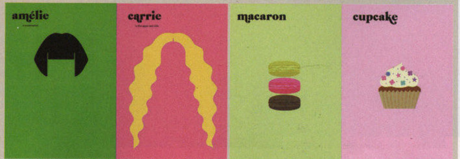
השוואות חינניות: מתוך הספר "פריז נגד ניו יורק"