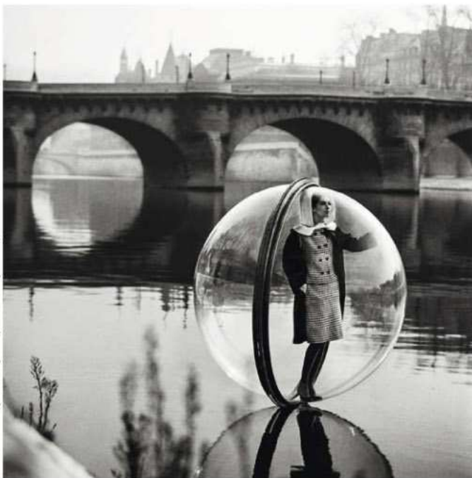
Mannequin immortalisé dans une bulle en Plexiglas sur la Seine, en 1963.

➔ Paris, portrait d'une ville, Jean-Claude Gautrand, éditions Taschen, 624 p., 49,99 euros.