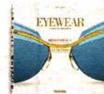
Eyewear – a visual history, Taschen 2011.