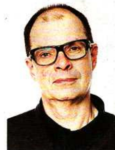
Skribenten i dag.