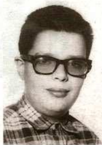
Skribenten som ung.

Bokens behållning, i alla fall för en inbiten glasögonfetschist som jag, ligger som sig bör i det visuella. Här finns såväl lorgnetter i sköldpadd, pincenez i guld och bågar i gethorn, kattögon i acetat och syntetbriljanter liksom tyska