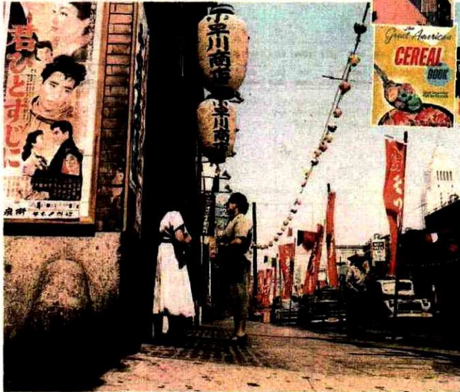
En 1953, la communauté japonaise de Los Angeles vit repliée dans le quartier nommé Little Tokyo.