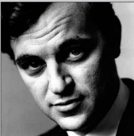
IRVING PENN (1962)

Bert Stern (1929) è uno dei grandi fotografi americani contemporanei, specializzato nel ritratto. Ha realizzato innumerevoli redazionali di moda e numerose campagne pubblicitarie, tra le quali si ricordano gli annunci innovativi per la vodka Smirnoff. Ovviamente, la sua fama è legata a doppio filo con l'ultima sessione fotografica di Marilyn Monroe, appunto spesso proposta come The Last Sitting (anche monografia), sei settimane prima della sua prematura scomparsa.