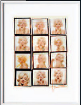
Stampe numerate e firmate, in tiratura di centoventicinque copie ciascuna, incorniciate in plexiglas per le due Art Edition di Norman Mailer/Bert Stern: Marilyn Monroe: rispettivamente, Striped Scarf, del 1962 (da 1 a 125), e Contact Sheet, del 1962 (da 126 a 250).