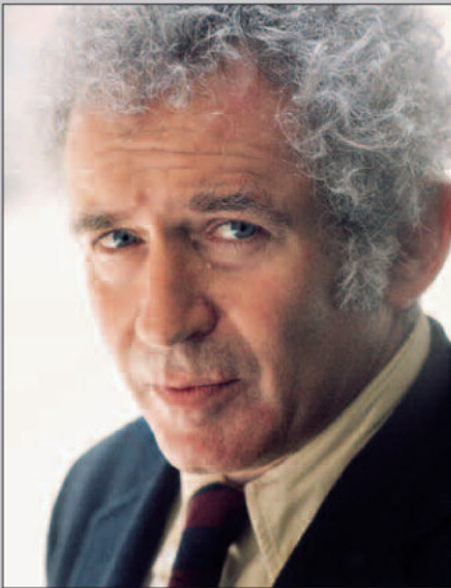
(1973 CIRCA)

In edizione Taschen, è disponibile la monografia MoonFire: The Epic Journey of Apollo 11 , del 2009, sia Collector's Edition , sia tradizionale.