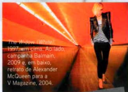
The Widow (White) 1997, em cima. Ao lado, campanha Balmain, 2009 e, em baixo, retrato de Alexander McQueen para a V Magazine, 2004.