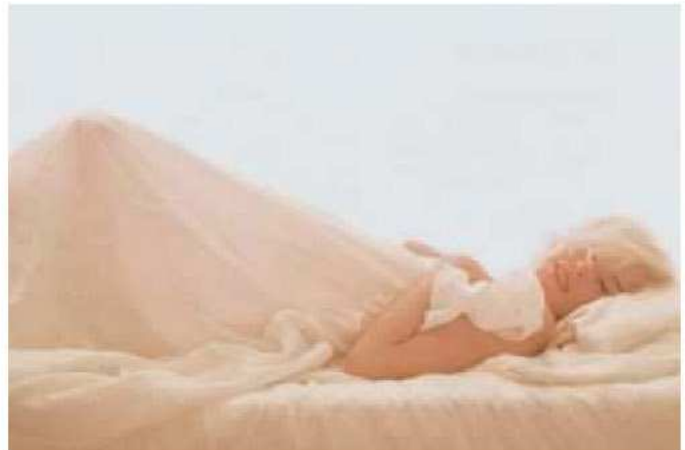
Ikone der 1960er Jahre: Marilyn Monroe

Norman Mailer, Bert Stern: "Marilyn Monroe", Taschen Verlag Köln, Hardcover in einer Schlagkassette, 278 Seiten, 750 Euro, ISBN 978-3-8365-1185-8, Ausgabe: Englisch