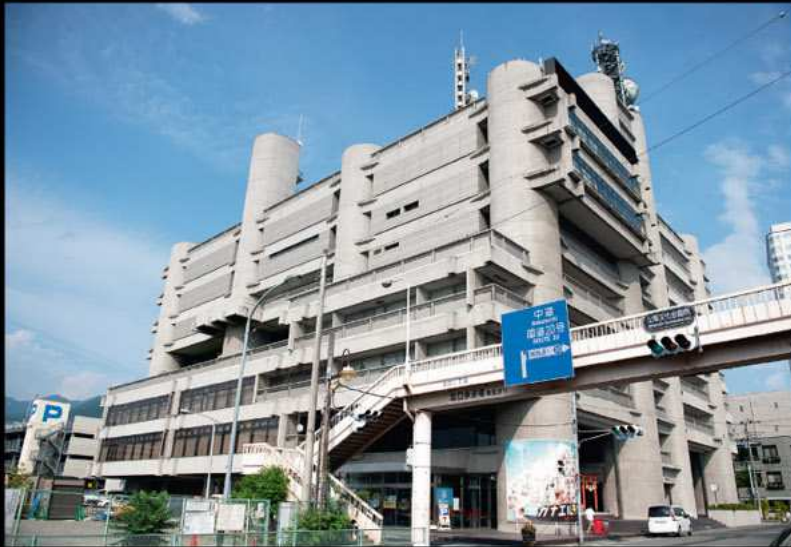
Jamanaši kultūras centrs. Arhitekts: par metabolistu tēvu uzskatītais Kenzo Tange.