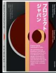
Grāmata Japan Projects. Metabolism Talks...