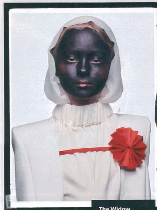
The Widow (White), 1997. « Art et mode sont deux domaines qui nous sont nécessaires. »

* « Pretty Much Everything », éd. Taschen.