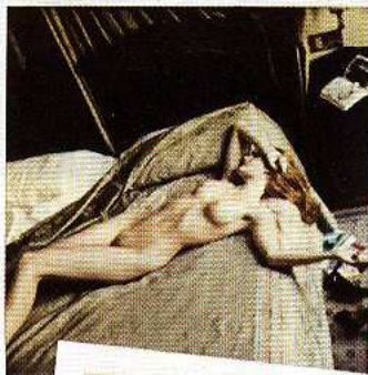
UN MIT NEWTON