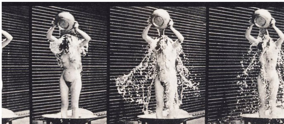
Abb.2: Die New York Times kommentierte diese Bilder einer nackten Frau, die sich mit Wasser übergießt am 5.3.1888 folgendermaßen: „Es wurde Vorsorge getroffen, dass die Nacktserie nicht von Leuten erworben werden kann, die nicht vorhaben, solche Arbeiten für ernsthafte Studien zu verwenden.“

lich „seine Ehre wiederhergestellt“ heißt es in der Urteilsbegründung.