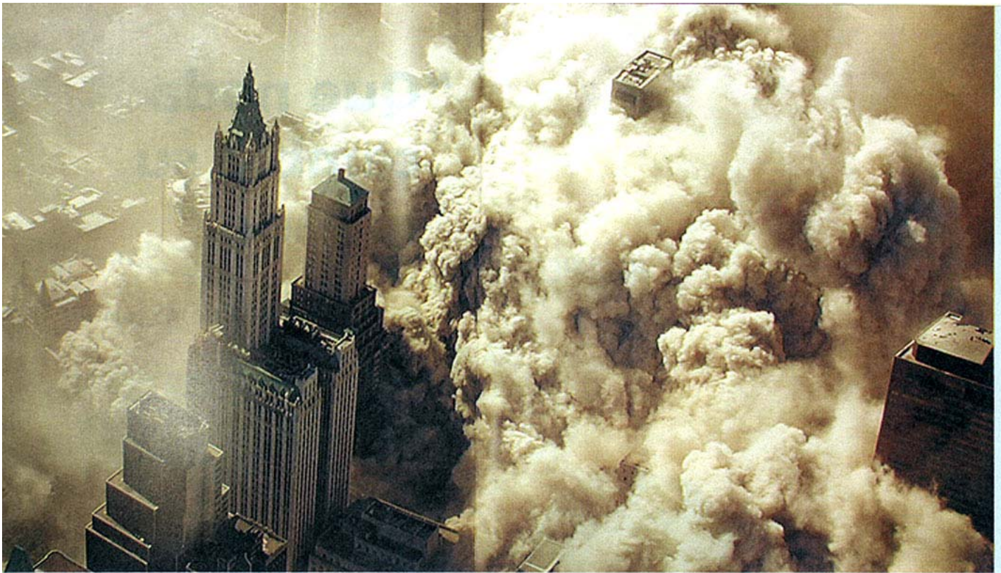
UNA VISION ESPELUZANTE. Esta fotografía aérea del derrumbe de las Torres Gemelas fue tomada desde un helicóptero de la policía y no se publicó hasta comienzos de 2010. Una nueva cara del atentado