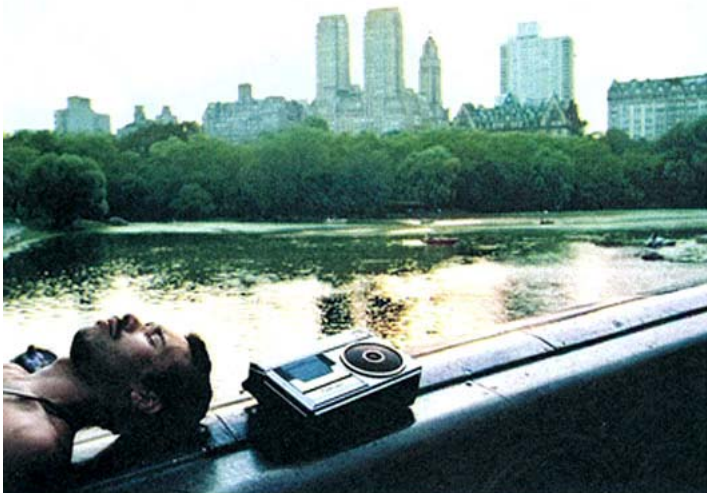
VERDE Y MUSICA (Ferdinando Scianna, 1985). El Central Park siempre ofreció un espacio para descansar del estrés y el ajetreo

El mejor disco del rapero de Brooklyn salió a la venta el 11 de septiembre