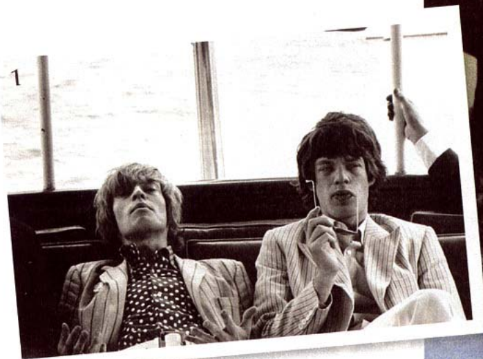
6 mujerhoy.com 14 de mayo de 2011

La pasión entre Linda Eastman y Paul McCartney fue fulminante: se casaron en seis meses y ella ya estaba embarazada de cuatro. Su relación duró más de 30 años, hasta que el cáncer de ella los separó. Cuando se cumplen 13 años de su muerte, Paul y sus hijos –Mary, Stella y James– han editado el libro “Linda McCartney, a life in photographs”, que pretende ser, en palabras del ex Beatle, “un testamento duradero”, un homenaje a la madre, a la esposa y a la fotógrafa que retrató a todos los que eran alguien en el mundo de la música con la mirada privilegiada de quien pertenecía a su propia tribu. “Ella ha inspirado a muchas mujeres que han seguido sus pasos”, cuenta Paul, entre ellas a su hija Mary McCartney, que ha heredado su talento para la fotografía y compite con otro libro en el que se mezclan sus recuerdos familiares con los retratos de decenas de “celebrities”.