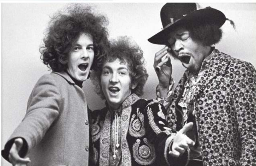
■ Een portret van The Jimi Hendrix Experience, in 1967 gemaakt in Londen.