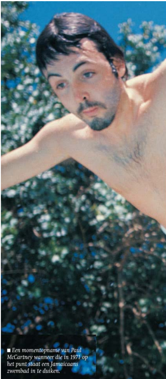
■ Een momentopname van Paul McCartney wanneer die in 1971 op het punt staat een Jamaicaans zwembad in te duiken.