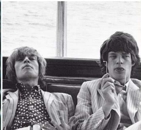
■ Een snapshot van Brian Jones en Mick Jagger dat Linda McCartney maakte in New York (1966).