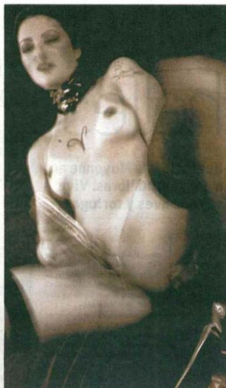
SPITFIRE JEFA DE VENTAS AL POR MENOR

»» 28 AÑOS. «Me suelo masturbar día sí, día no, aunque también pueden ser varias veces al día. A veces tengo a mi novio al lado, en la cama. Tengo tres pequeños [vibradores] Doc Johnson Pocket Rockets, de distintos colores (violeta, fucsia y verde), y los llevo siempre encima cuando salgo de viaje de negocios o agonde quiera que vaya, pero solo para estimular el clítoris. No me meto nada dentro».