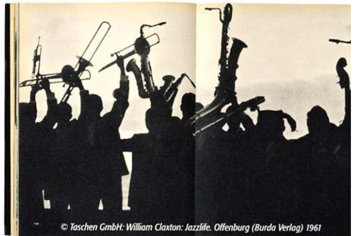
William Claxton: Jazzlife, Offenburg (Burda Verlag) 1961

Ansel Adams, Manuel Álvarez-Bravo, Nobuyoshi Araki, Diane Arbus, Richard Avedon, David Bailey, Elmer Batters, Peter Beard, Cecil Beaton, Werner Bischof, Guy Bourdin, Bill Brandt, Robert Capa, William Claxton, Anton Corbijn, Robert Doisneau, William Eggleston, Masahisa Fukase, Nan Goldin, Jean-Paul Goude, John Heartfield, Eikoh Hosoe, George Hoyningen-Huene, Peter Lindbergh, Man Ray, Robert Mapplethorpe, Jean-Baptiste Mondino, Helmut Newton, Martin Parr, Irving Penn, Pierre et Gilles, Bettina Rheims, Leni Riefenstahl, Sebastião Salgado, Andres Serrano, Lord Snowdon, Bert Stern, Wolfgang Tillmans, Ellen von Unwerth, Andy Warhol, Bruce Weber.