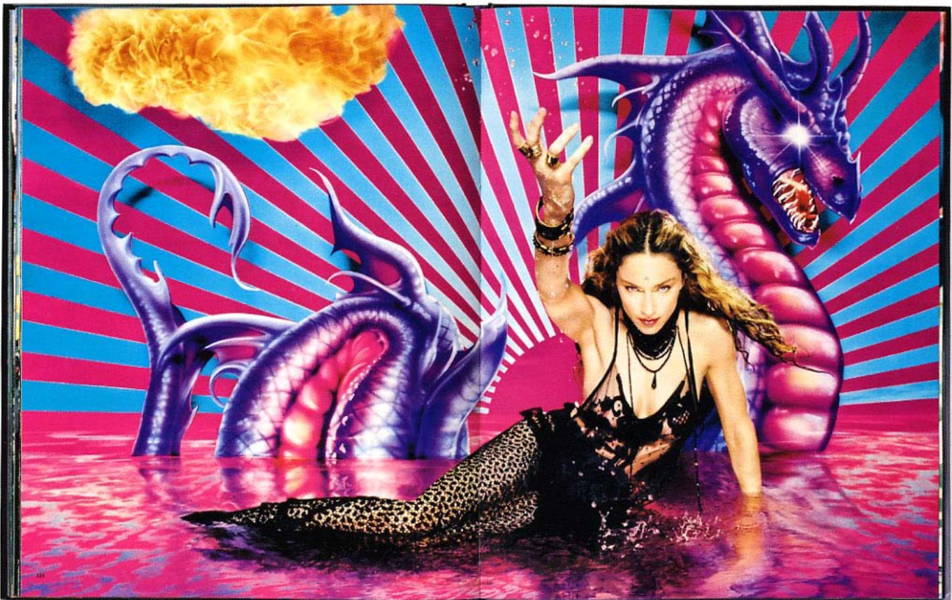
© Taschen GmbH: David LaChapelle: Hotel LaChapelle, New York (Ginkgo Press/Calloway) 1999