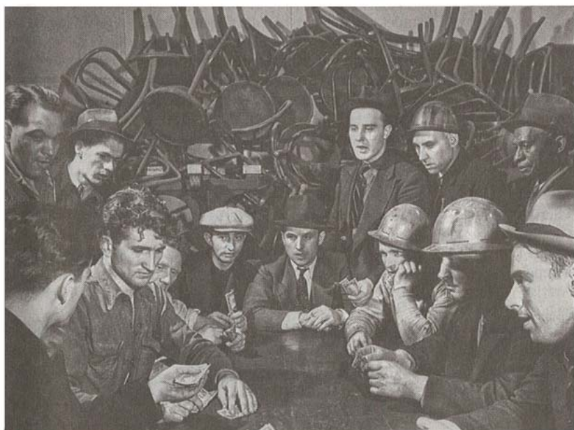
1939. Bygningsarbejdere spiller kort i frokostpausen. Disse 'sandhogs' byggede metroen, kloaksystemet, vandforsyningen og andre underjordiske værker.