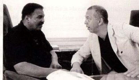
Muhammad Ali besucht Benedikt Taschen im TASCHEN-Büro auf dem Sunset Boulevard, Hollywood, Kalifornien, 2003