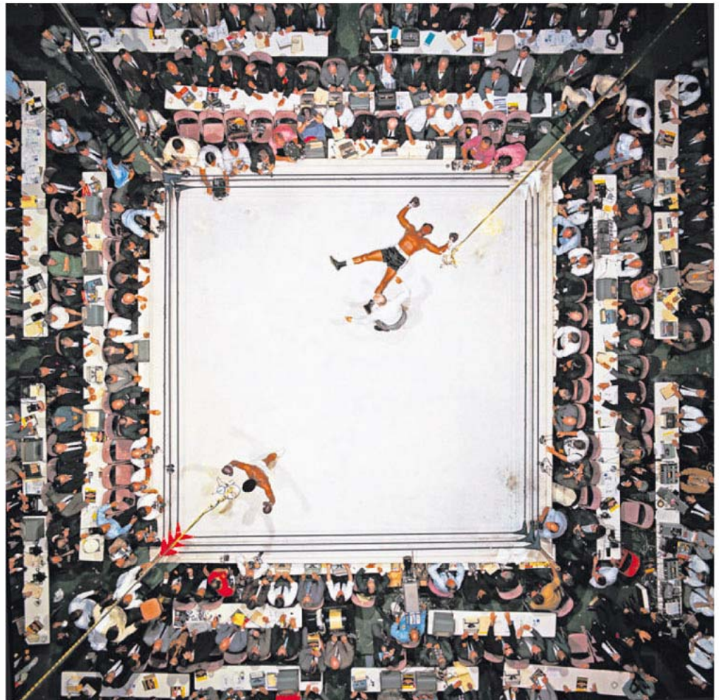
Le 14 novembre 1966, Ali vient de terrasser Cleveland Williams. Un combat - et une photo - culte.