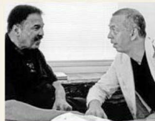
Muhammad Ali et le PDG-fondateur Benedikt Taschen, en 2003.

Non. Mais les beaux livres que nous produisons sont tous pensés pour devenir des éditions moins chères une fois les frais de production amortis. Le grand public bénéficie de la contribution initiale des plus riches. Ce n'est pas seulement une opération de rétrécissement: l'ADN du livre demeure, mais le format et les matériaux changent.