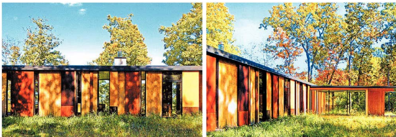
Rot, Gelb oder Holz – das amerikanische „Camouflage House“ greift die Farben des herblichen Waldes auf und verschmilzt so mit seiner Umgebung

Argentinien, Spanien oder Japan – ein aktuelles Buch lädt mit spannenden Hausentwürfen zu einer architektonischen Weltreise ein.