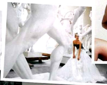
Senna Miller (izda.) y Claudia Schiffer son dos de las retratadas por Testino para la muestra madrileña.