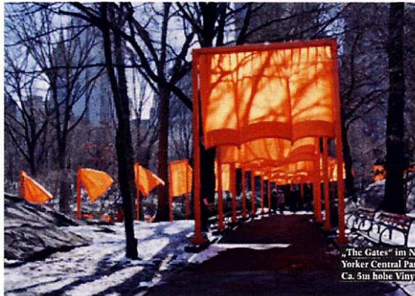
„The Gates“ im New Yorker Central Park '05. Ca. 5m hohe Vinyltore

„CHRISTO UND Jeanne-Claude“ ist das einzige großformatige Buch über das komplette künstlerische Wirken des unvergleichlichen Paares. Vom Frühwerk ab 1958 bis hin zu ihren spektakulären, temporären Projekten, wie „The Gates“ im New Yorker Central Park, der bereits