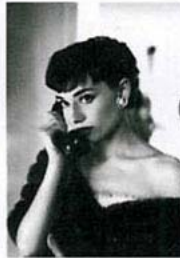
Una de las fotos del libro, tomada en 1953 en los Estudios Paramount.