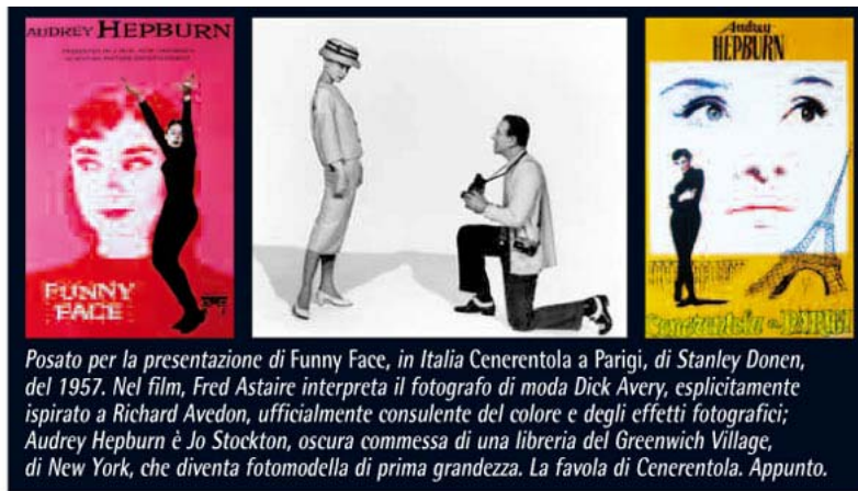
Posato per la presentazione di Funny Face , in Italia Cenerentola a Parigi , di Stanley Donen, del 1957. Nel film, Fred Astaire interpreta il fotografo di moda Dick Avery, esplicitamente ispirato a Richard Avedon, ufficialmente consulente del colore e degli effetti fotografici; Audrey Hepburn è Jo Stockton, oscura commessa di una libreria del Greenwich Village, di New York, che diventa fotomodella di prima grandezza. La favola di Cenerentola . Appunto.

commessa di libreria del Greenwich Village, di New York, trasformata in affascinante modella: appunto Cenerentola , dall'intellettualismo di maniera ai fasti dell'effimero, nell'interpretazione di Audrey Hepburn, nei panni di Jo Stockton.