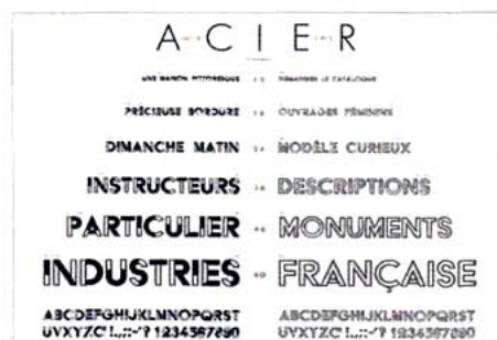
Page 351 du livre. Une des polices créées par Cassandre en 1936 : l'acier gris et noir par les Fonderies Deberny & Peignot à Paris en 1936.

Un voyage dans le siècle dernier ! Voilà ce que propose Taschen en publiant le second tome de cette anthologie de typographie et d'ornementation d'imprimerie, Histoire visuelle des fontes et styles graphiques.