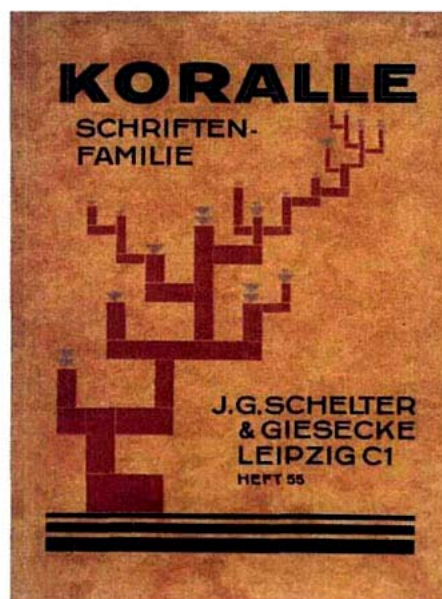
Page 294 du livre. Couverture du catalogue de la fonte sans empattement Koralle dessinée par J.G. Schelter & Giesecke à Leipzig en 1926.

Il faut bien le dire, l'ouvrage fonctionne. Par son grand format d'abord (21 x 31,7 cm) : il évolue comme un écran qui expose l'ingéniosité des inventions des typographes de cette époque. Les fontes les plus en vogue du début de siècle jusqu'aux Memphis dessinées par Rudolph Koch en 1938 sont passées en revue. Ensuite par la grâce sobre de sa mise en page : des planches de polices, d'ornementations, d'illustrations comme des allégories, répondent élégamment à des fonds striés pour composer les billets de banque ou des couvertures des principaux catalogues de fontes... Le tout est ponctué par le