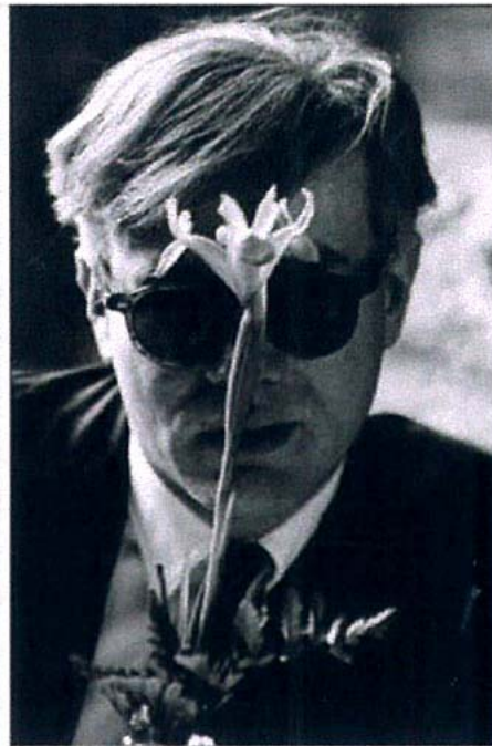
Andy Warhol (with flower) face à l'objectif de Dennis Hopper en 1963.