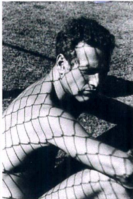
Paul Newman photographié par Dennis Hopper en 1964.