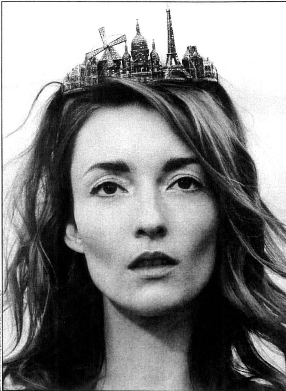
Bettina Rheims, courtesy gallery Jérôme de Tommaso, Paris