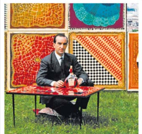
Au-delà de sa mort, survenue le 29 novembre 1992, le marquis Emilio Pucci continue de fasciner les stars telles que Kylie Minogue. Ici, il pose devant les foulards de la collection «Palio» au fort Belvedere, à Florence, en 1959.

Une mode hallucinée et vaporeuse, comme sortie d'un rêve en technicolor ou de délires sous l'effet de substances... Depuis les débuts du couturier dans les années 1940, les créations d'Emilio Pucci ont marqué les esprits. De la reine de Hollywood Marilyn