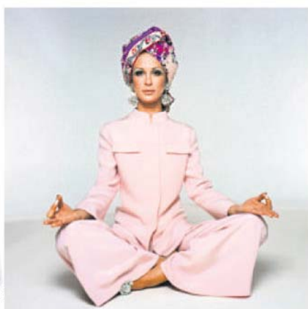
Pyjama Palazzo et turban imprimé en soie brodé de cristaux Swarovski de la collection automne-hiver 1969.