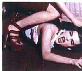
Bitchi Paris 2007