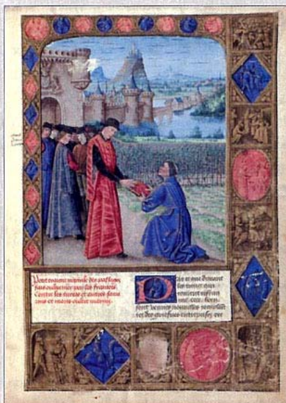
Scène de dédicace. Enluminure par Jean Colombe