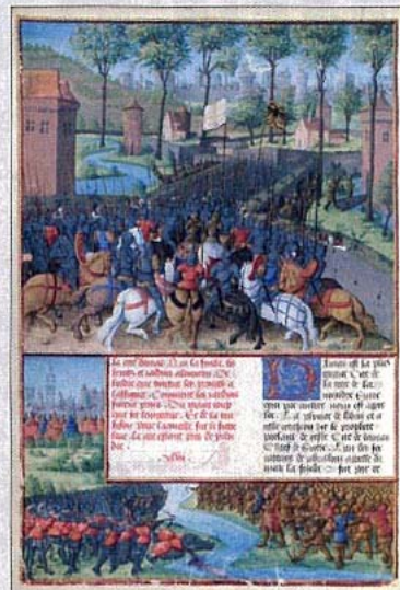
Arrivée des croisés à Damas. Enluminure par Jean Colombe

Thierry Delcourt, Danielle Quéruel, Fabrice Masanès, Editions Taschen, 2 vol. sous coffret, 816 p. (100 €)