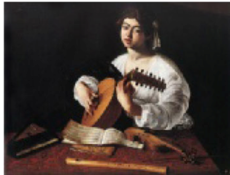
> "El tañedor de laúd" (1595/96). Colección privada, en préstamo extendido al Museo Metropolitano de Arte de Nueva York