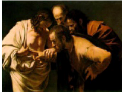
> "La incredulidad de Santo Tomás" (1601/02). Del Palacio de Sanssouci, en Potsdam, Alemania

La Biblia, la mitología y las escenas cotidianas nutrieron la obra de Caravaggio.