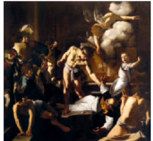
> "El martirio de San Mateo" (1599/1600). De la Iglesia de San Luis de los Franceses, en Roma