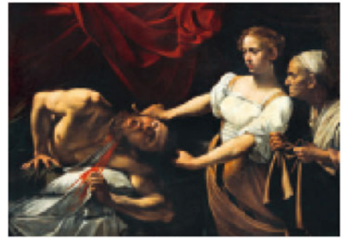
> "Judith y Holofernes" (1598/99). De la Galería Nacional de Arte Antiguo del Palazzo Barberini