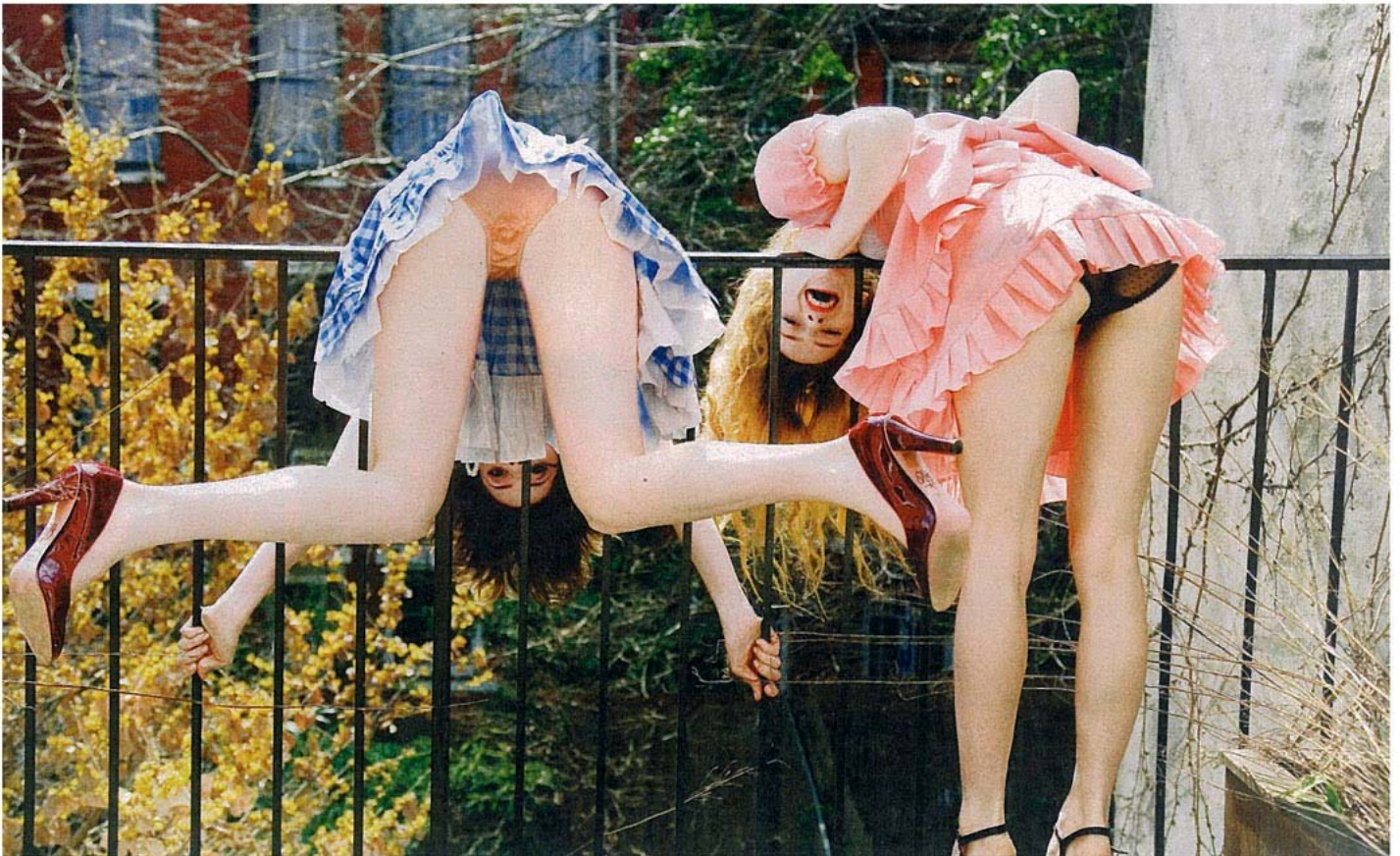
STILSTAAND FILMBEELD 'Ik vind mijn foto's geslaagd als ze iets weghebben van een stilstaand filmbeeld', zegt Von Unwerth over haar fotografijstijl.

dan in de camera zelf. De beslissing wat je gaat fotograferen lijkt me belangrijker dan welke techniek je gaat gebruiken." Veel van haar foto's zijn out of focus , iets wat je bij weinig modefotografen ziet. Von Unwerth heeft er haar handelsmerk van gemaakt. "Nochtans doe ik het niet bewust. Ik schiet foto's in een snel tempo en mijn modellen bewegen veel. Ik zie een leuk beeld en ik wil het onmiddellijk vastleggen op foto. Als ik een reeks negatieven bekijk, is de eerste foto die mij onmiddellijk opvalt, bijna altijd onscherp. Anderen geven dan het commentaar dat de focus niet juist zit, maar dat is net wat me aantrekt. Het geeft extra emotie."