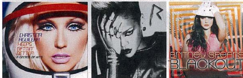
MUZIEK Von Unwerths werk op de cd-covers van Christina Aguilera, Rihanna en Britney Spears. Minder bekend is dat de fotografe ook al videoclip heeft geregisseerd.

prijs. Het Franse alternatieftrendy blad Jill publiceerde meteen zes pagina's. "De shoot werd opgemerkt door de Britse ontwerpster Katharine Hamnett en zij vertrouwde me dadelijk een nieuwe campagne toe. En toen deed ik Guess Jeans met Claudia en ik was vertrokken. Het is allemaal héél snel gegaan." Op amper twintig jaar tijd bereikte Ellen von Unwerth de absolute top in twee verschillende domeinen.