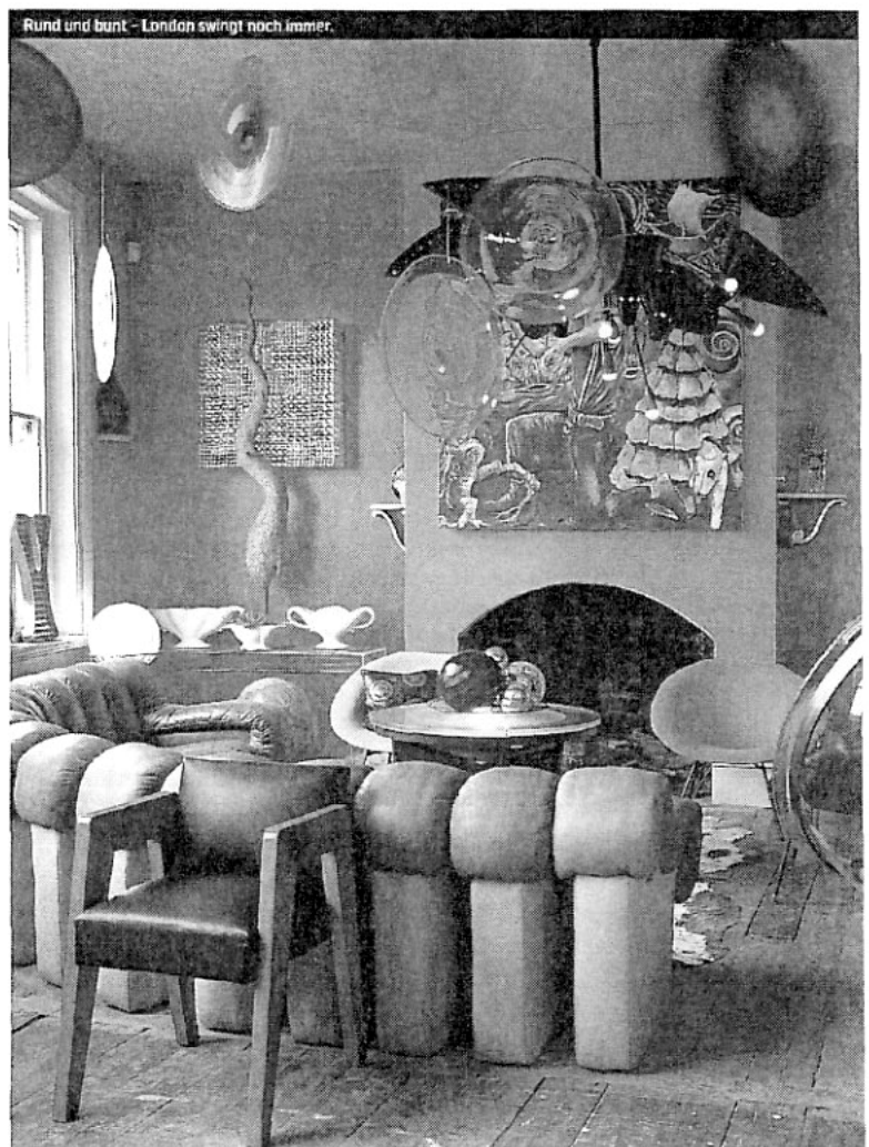
Rund und bunt – London swingt noch immer.