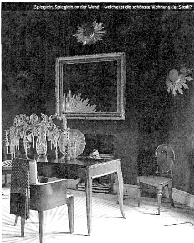
Spiegeln, Spiegeln an der Wand – welche ist die schönste Wohnung der Stadt?