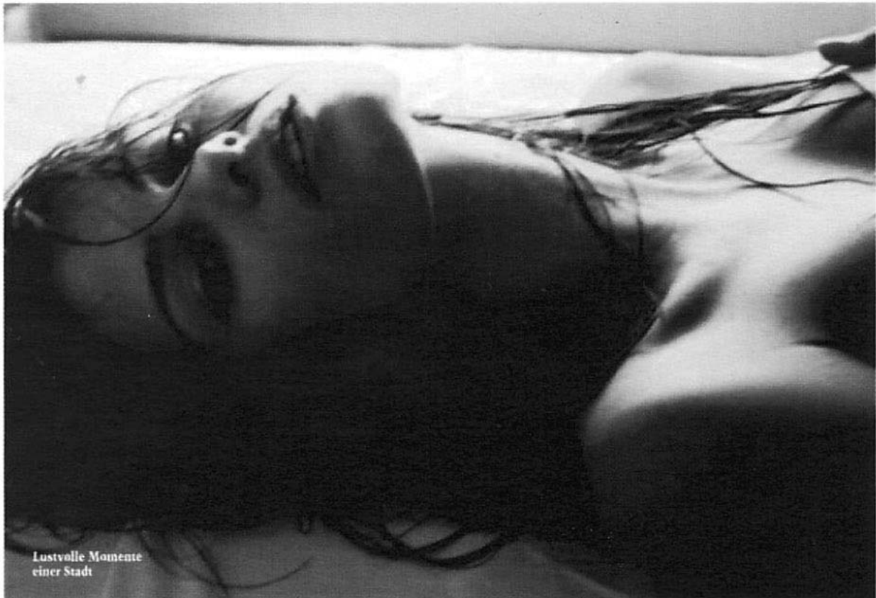
Lustvolle Momente einer Stadt

hat. Mario Testino gehört schon seit Langem zu den gefragtesten Mode-Fotografen der Welt. Er ist der Meister des Schönen. Er öffnet uns den Blick auf das Gute im Menschen. Seine kompromisslose Hochglanzästhetik weckt bei uns das Gefühl, dass es so etwas wie Vollkommenheit geben könnte, dass wir Teil der Wahrheit sind, wenn auch nur als Beobachter. Testinos Werke sind Kunst. Sie schmücken die Sammlungen der Galerien rund um den ganzen Globus, von Japan bis New York. Er sagt selbst über sich, dass er ein glückliches Kind war, seine Eltern haben ihn verwöhnt: „Wir waren nicht reich,