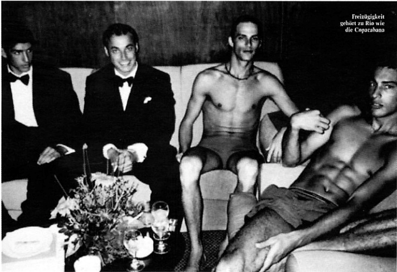
Der Starfotograf Mario Testino bekennt sich zu seiner Liebe