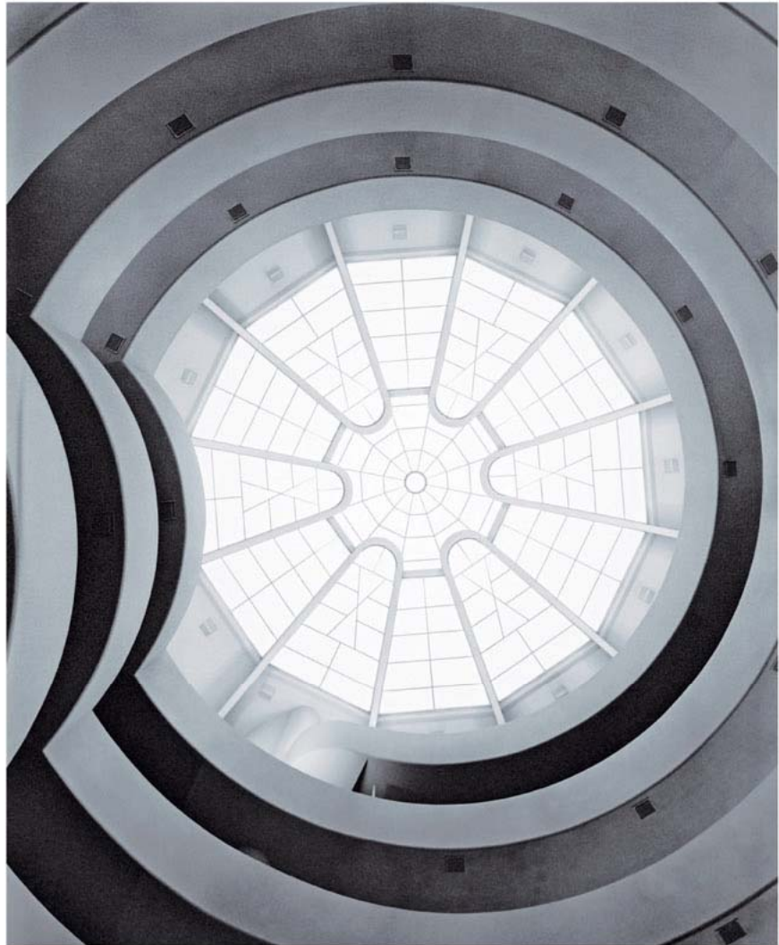
Vista desde abajo de la rampa helicoidal del museo, que culmina en una gran cúpula-lucernario

La exposición abarca objetos en diversos soportes, incluyendo más de 200 dibujos originales; maquetas históricas, y otras recientes diseñadas especialmente para la ocasión; fotografías de archivo y contemporáneas; así como libros, revistas y correspondencia relacionados con la muestra. Además, se han creado vídeos y animaciones digitales que facilitan la interpretación de los diseños de Wright y su visión de la arquitectura como una extensión vital de la vida cotidiana.