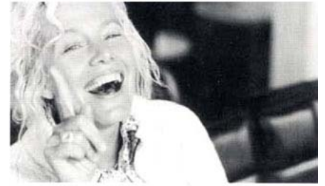
Ellen von Unwerth